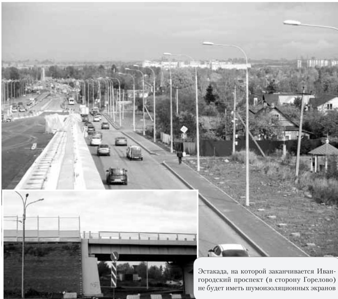
Эстакада, на которой заканчивается Ивангородский проспект (в сторону Горелово) не будет иметь шумоизоляционных экранов