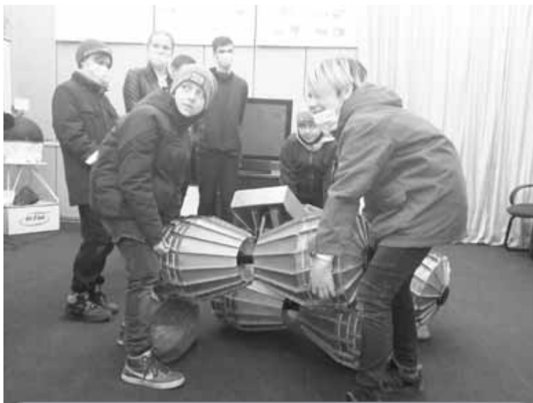
Ребята смогли потрогать руками образцы уникальной техники – шасси «Марсохода» (вверху) и «колесницу», на которой должны были перемещаться участники будущей экспедиции на Луну (внизу)