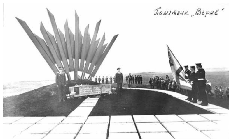
Открытие мемориала «Взрыв», 11 сентября 1987 года

Власти Ленинградской области собираются реставрировать памятный знак «Взрыв», установленный на рубеже обороны Ленинграда вблизи Дудергофа