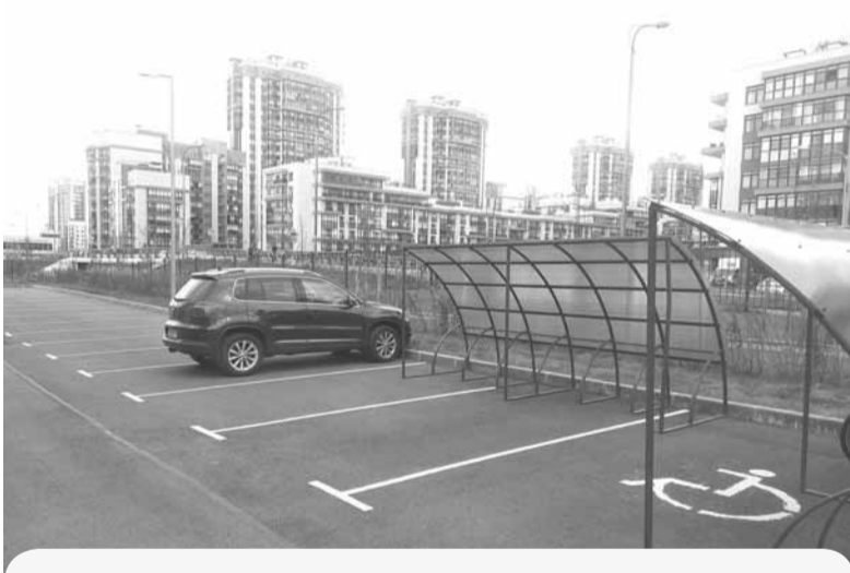
Парковка у новой поликлиники в «Балтийской жемчужине» недостаточна для посетителей, как и у поликлиник в Красном Селе.

В районе Балтийской Жемчужины недавно была введена в