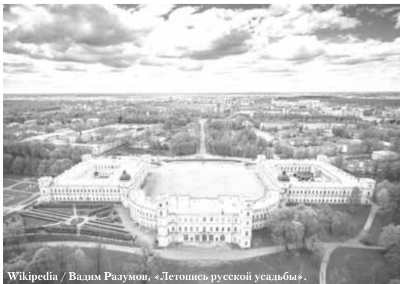
Wikipedia / Вадим Разумов, «Летопись русской усадьбы».