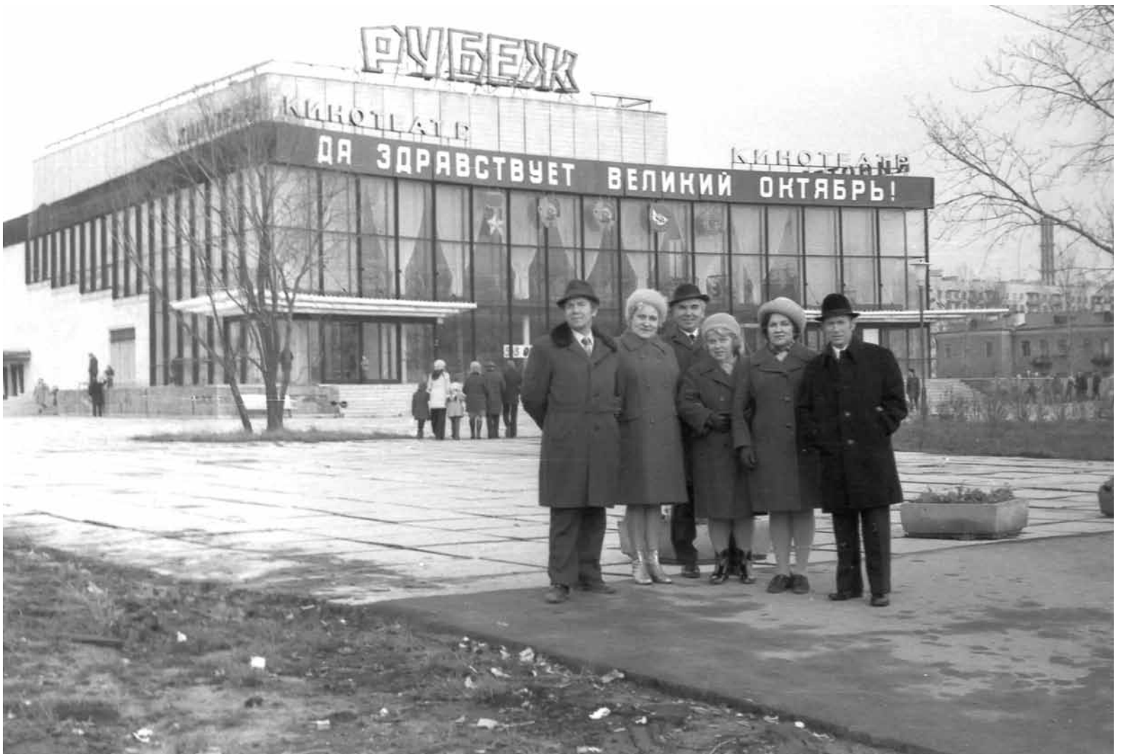
Ровесник района – кинотеатр «Рубеж» на проспекте Ветеранов. Он был построен в 1973 году. В 2016-м кинотеатр переоборудовали в фитнес-клуб.

Сейчас в районе, по данным статистики, проживает 420 тысяч человек, как в крупном областном